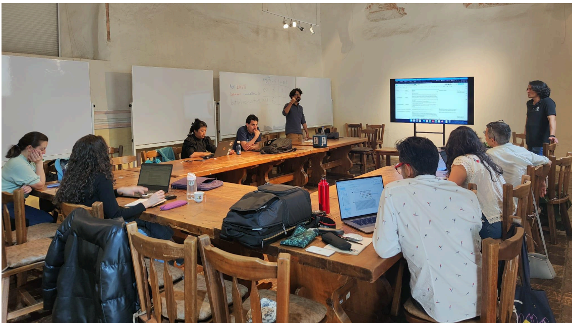
Presentación de los casos de uso durante el Discovery Wokshop