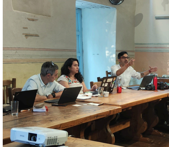
Intercambio de ideas y debate