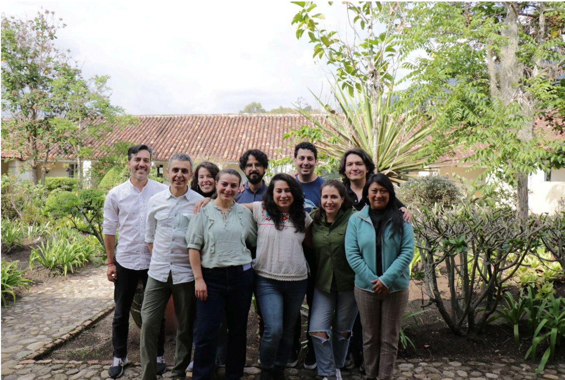
Foto grupal de cierre del Discovery Wokshop